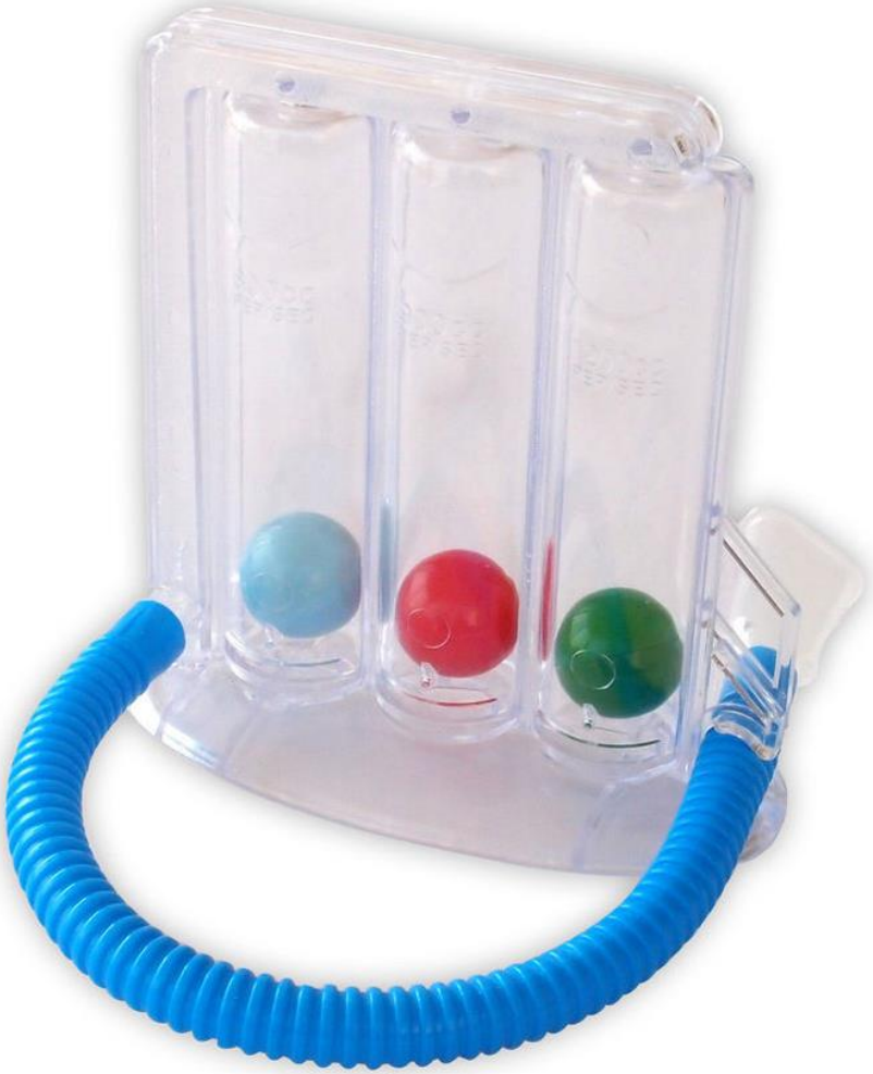
جهاز تمارين التنفس