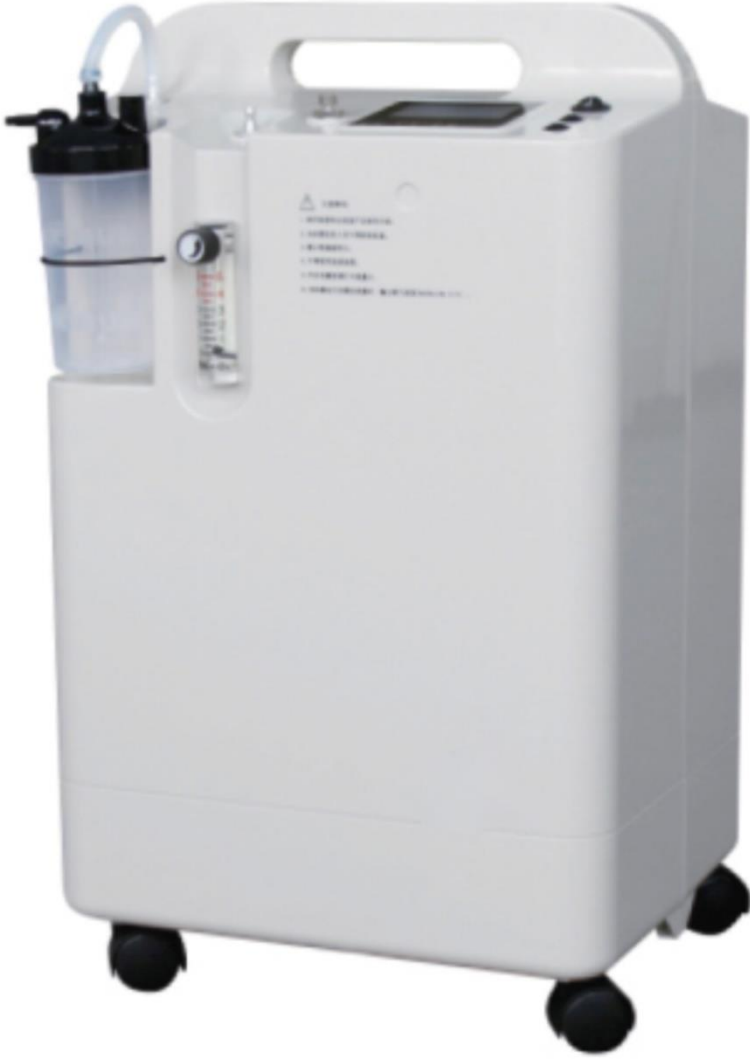
جهاز توليد الأوكسجين المنزلي (Oxygen Generator)

..... دليل العزل الصحي المنزلي لمرضى كوفيد ١٩